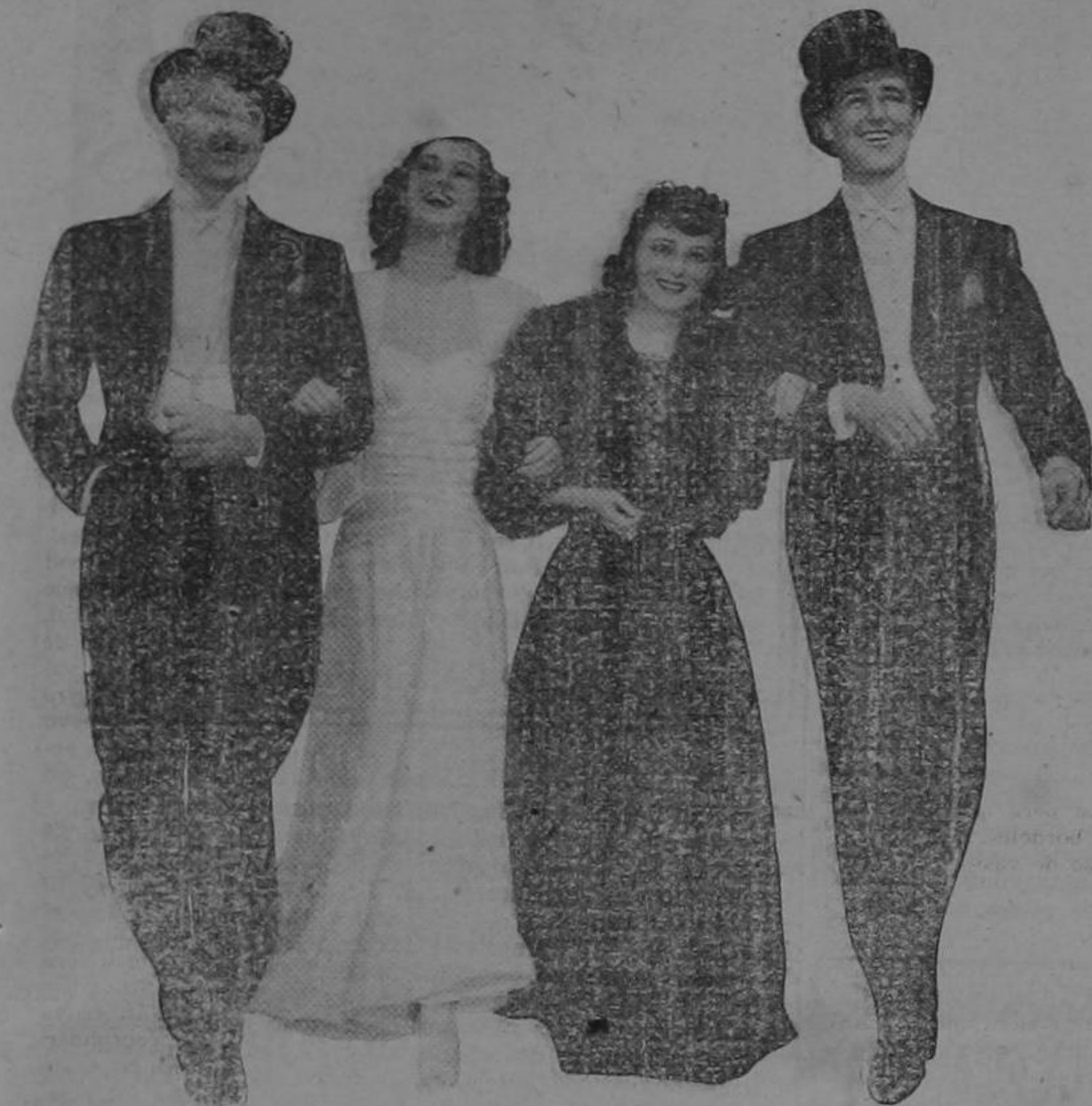
Errol Flynn, Rosalind Russell, Olivia de Havilland y Patric Knowles en la comedia social "El Hombre Propone" producida por la Warner Bros

En Hollywood muchos hombres se ondulan el cabello, se pintan y se cuidan el cutis, la figura y las manos con el mismo esmero que las damas.—Esto no lo hacen por artificio o afición a las modas femeninas sino porque su trabajo ante la cámara exige la mayor perfección en su apariencia y porque tienen que alternar con las estrellas